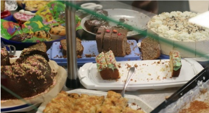
Legendar: Die Kuchenvielfalt bei Festen an der Regenbogenschule

Wenn Ihr Kind bereits auf die Regenbogenschule geht, erinnern Sie sich sicher noch an den Einschulungstag. Kaffee und Kuchen werden an unserer Schule traditionell von engagierten Eltern für die wartenden „Neuen“ gespendet und ausgeteilt.